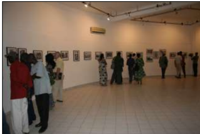
L'exposition Bamako 1960 est présentée dans la grande salle du musée.