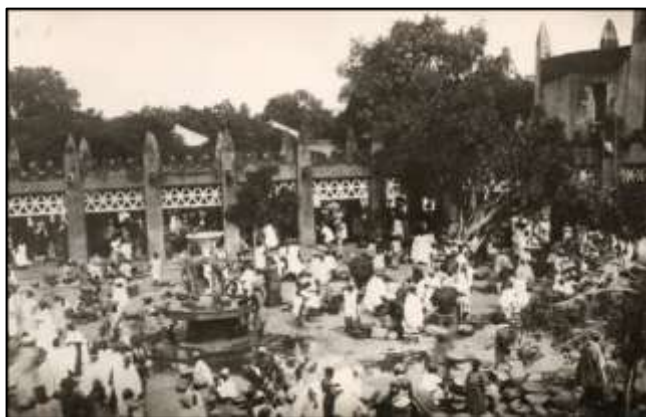
Ci-dessus en haut : Vue du centre (édition de la librairie Ferré).

En dessous : Le Marché (édition A. Challah). Le marché présenté est le marché artisanal de Bamako dit "Marché rose", achevé en 1925. Il existe toujours aujourd'hui, reconstruit à l'identique après un incendie survenu en 1993.