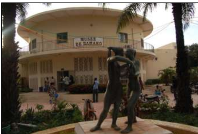
Le Musée de Bamako.

Cette exposition iconographique correspond à la ligne muséale que s'est donnée, depuis plusieurs années, le Musée du district de Bamako qui s'est fait une spécialité de la présentation d'images anciennes au public malien. Ainsi, le Musée de Bamako a-t-il développé depuis 2007 un partenariat fructueux avec l'association Images & Mémoires qui apporte, autant qu'elle le peut, son soutien aux expositions iconographiques concernant les pays d'outre-mer. Le Musée de Bamako avait déjà organisé, en 2008, avec Images & Mémoires, l'exposition du centenaire de la capitale : 1908 : Bamako, capitale du Haut-Sénégal-Niger . De même, il a présenté au printemps 2010 l'exposition itinérante L'Afrique en Noir & Blanc, du fleuve Niger au golfe de Guinée (1887-1892) Louis Gustave Binger « explorateur » qui a pris la route d'Abidjan vers le Musée des Civilisations de Côte d'Ivoire. Bamako 1960 est donc la troisième exposition que le Musée de Bamako réalise avec notre association dont il est membre.