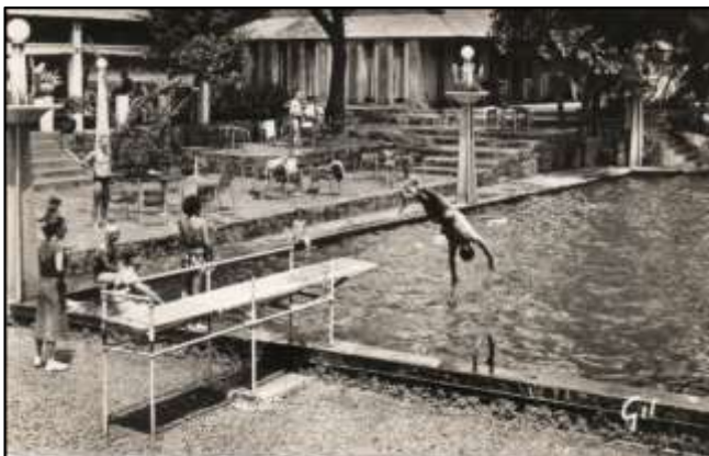
Ci-dessus : La piscine du Lido.

Construit à la fin des années 30 par Robert de Livry, l'hôtel Le Lido, disparu en 1991 dans un incendie, était un lieu agréable à six kilomètres de la ville. Situé sur la rive droite du Farako, il comprenait trois terrasses aménagées autour de la piscine et un restaurant. Une passerelle enjambait la rivière et donnait accès à la route de Kati, située sur la rive gauche. À côté de l'hôtel, un étang accueillait les amateurs de ski nautique.