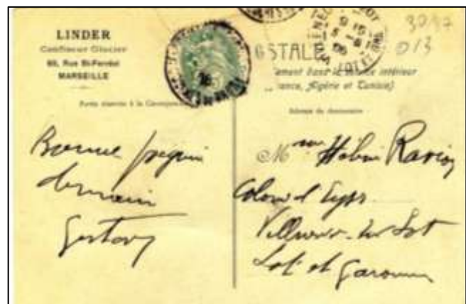
Les cartes postales publiées par Moullot Fils Aîné, Marseille ; 9 x 14 cm (Inscription publicitaire pour le "Buffet Café Glacier LINDER" au recto et au verso de l'une des cartes)