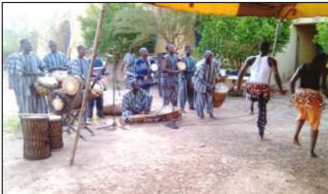
Le Ballet national est présent