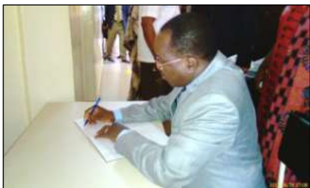
Monsieur Baba Hama, ministre de la Culture et du Tourisme, signe le livre d'or