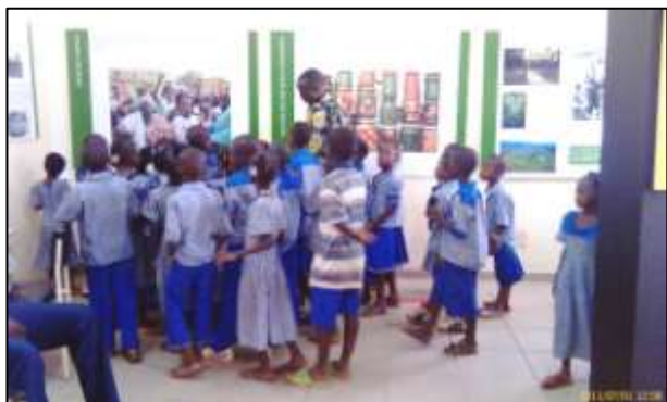
Tout un programme en faveur des scolaires a été monté jusqu'à la fin de la semaine. Plus de 400 élèves visitèrent alors le musée.