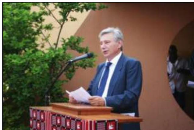
Allocution du président d'Images & Mémoires