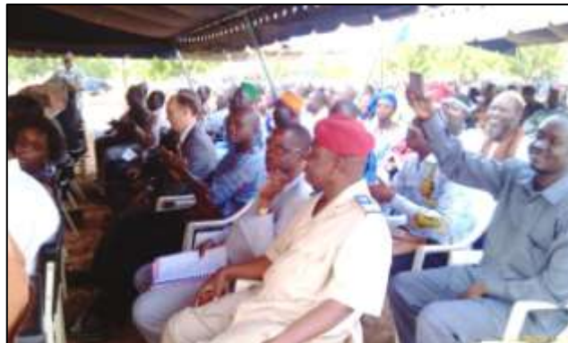
Les visiteurs écoutent les allocutions