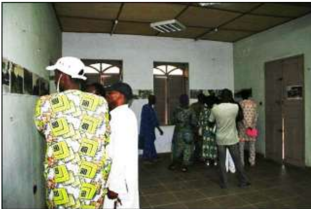
Ci-dessous : visite de l'exposition et cocktail