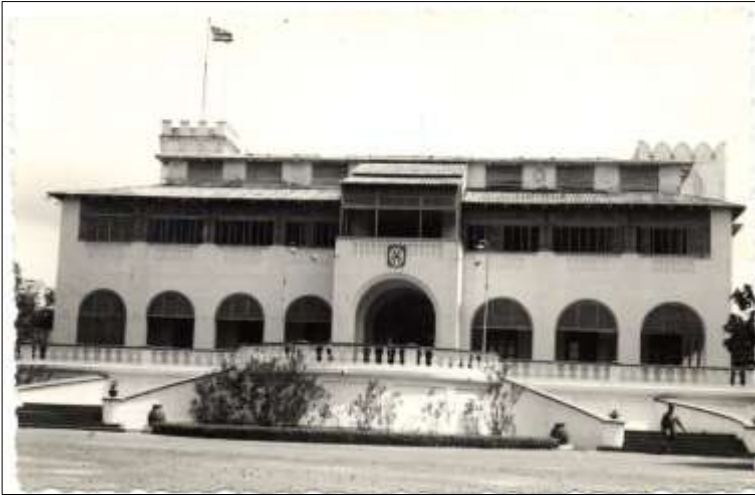
Ci-dessus : La Présidence