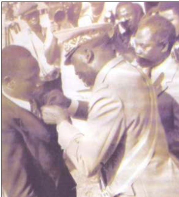
A gauche : Degbava élevé au rang de chevalier de l'Ordre National du Mérite le 25 avril 1975 par le Président d'alors, le Général Eyadema Gnassingbe