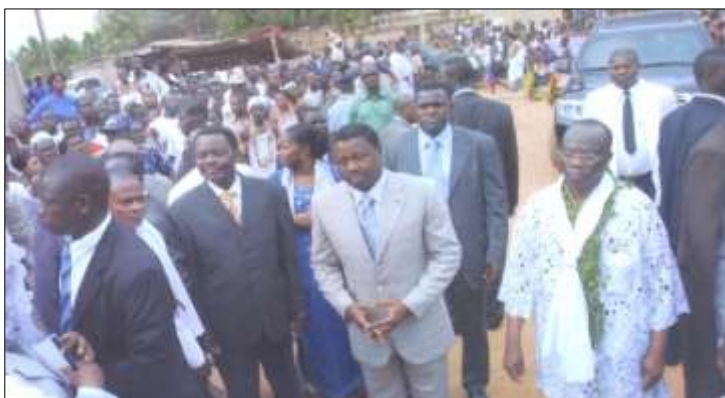
Ci-dessus : Degbava avec le Président Faure Gnassingbe à la fête traditionnelle des Guin (Epe ekpe) à Glidji dans la préfecture des Lacs au Togo.