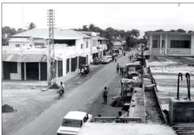
Ci-dessus : Rue de l'Eglise. L'une des plus anciennes de la capitale. LOMÉ. REP. TOGO. Carte postale à bords ondulés. 15x10 cm.