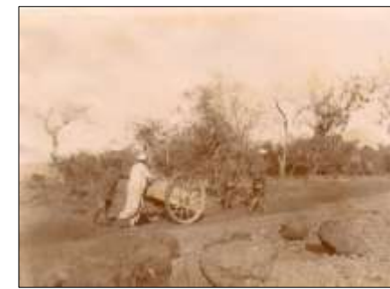
Le talus du chemin de fer