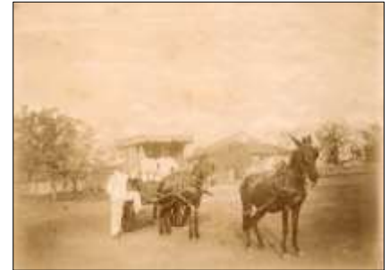
La voiture du 2 e régiment de Sénégalais