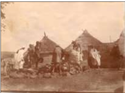
Cuisine à Kati