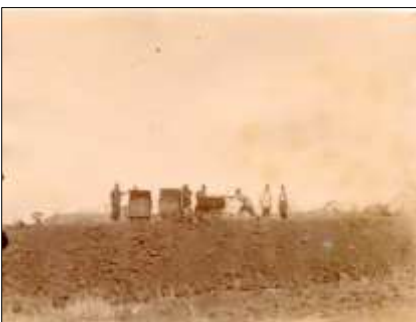
Vers la route des convois