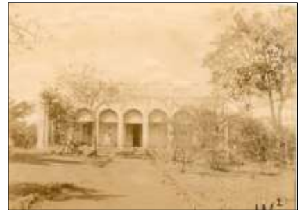
Le logement du colonel