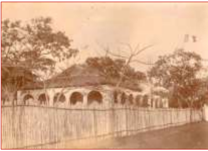
La maison du résident civil