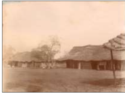
Le logement des sous-officiers