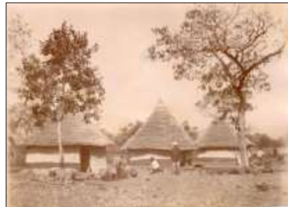
Le camp des conducteurs