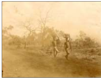
La route des convois de Kati à Kita