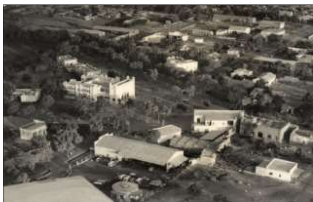
◀ Ouagadougou – Le Palais de Justice. Photographie anonyme (Collection Guy Hugues).

Au centre de l'affiche : le plan de Ouagadougou en 1958