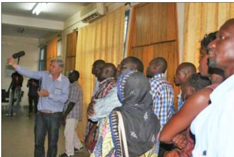
Ci-dessus : La visite lors de l'inauguration

Cette exposition a été installée au Musée National du Burkina Faso à la fin du mois d'octobre 2014. En raison de la diffusion du virus Ébola qui menace le pays, l'inauguration n'a pu avoir lieu comme c'est le cas de toutes les manifestations de ce genre dans le pays. Nous avons donc décidé d'une petite présentation informelle que nous avons dû déplacer à la dernière minute en raison d'une grande manifestation prévue dans la capitale. Nous avons fini par nous retrouver au nombre d'une quarantaine pour la visite de l'exposition qui fut suivie d'un petit cocktail. Le lendemain, une nouvelle manifestation provoqua le départ du président du Faso.