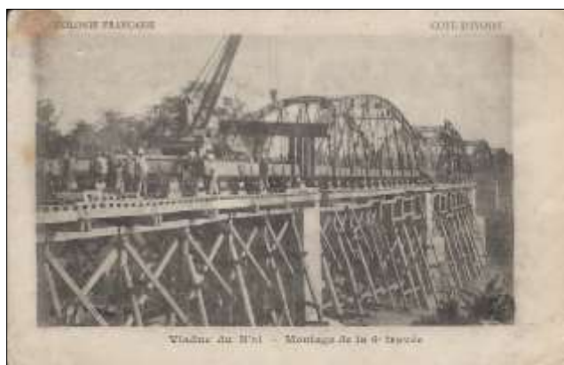
Viaduc du N'zi – Montage de la 6 e travée