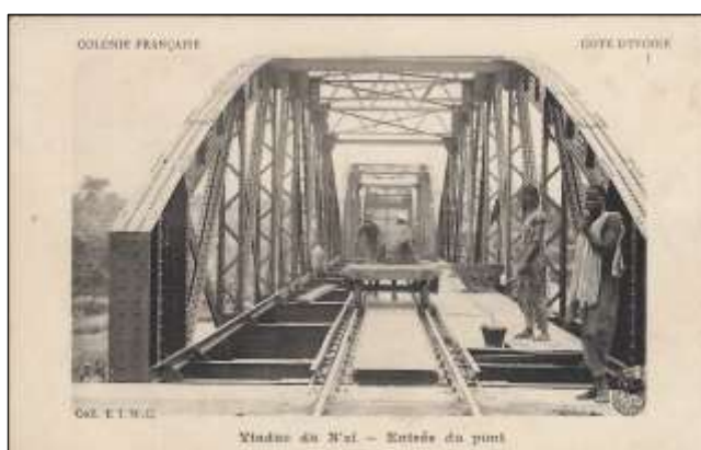
Viaduc du N'zi – Entrée du pont