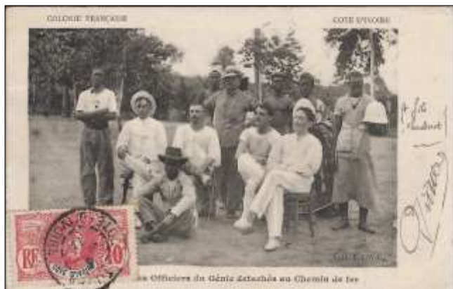
Groupe de Sous-Officiers du Génie détachés au chemin de fer