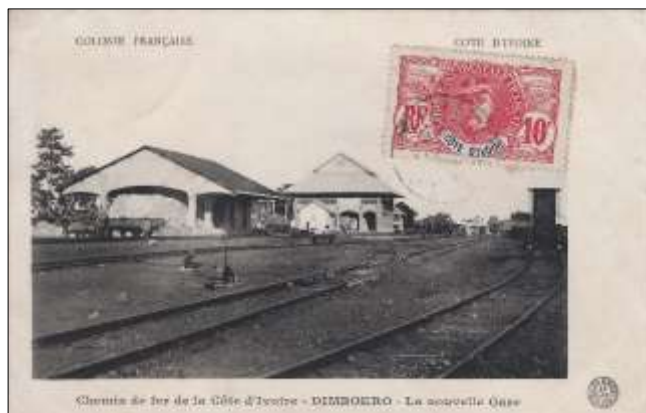
Chemin de fer de la Côte d'Ivoire – DIMBOKRO - La nouvelle Gare