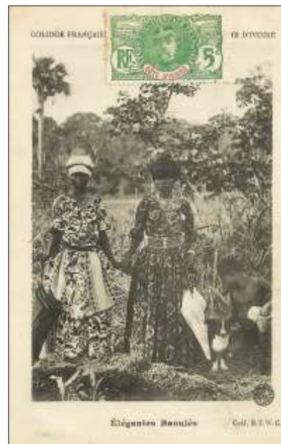
Élégantes Baoulés 9