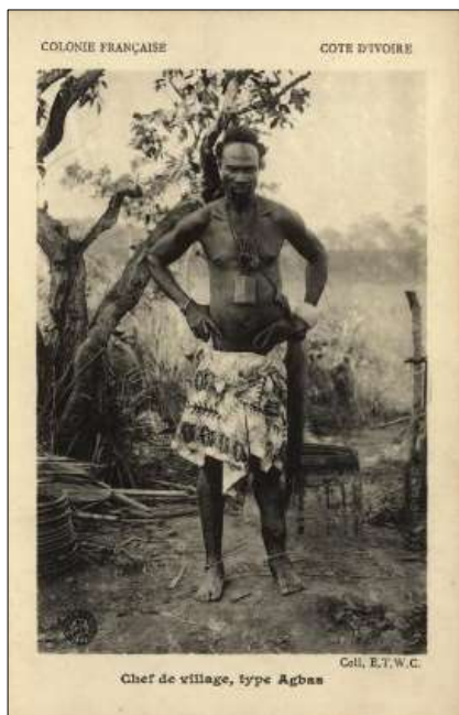
Chief de village, type Agbas