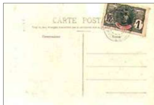
Texte d'une CP écrite par ETWC, sans doute à son arrivée en Côte d'Ivoire (La carte ne semble pas être une des siennes) Source : Guenneguez 6 p.92