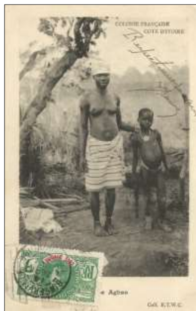
Femme type AGBAS