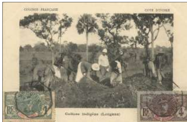
Culture indigène (Longans)