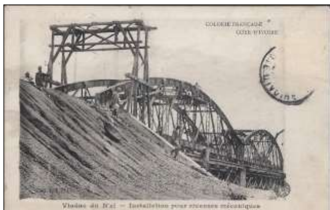
Viaduc du N'zi – Installation pour riveuses mécaniques