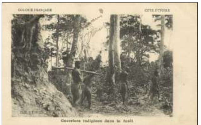
Guerriers indigènes dans la forêt