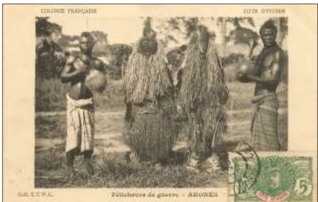
Féticheurs de guerre - AKONES [Akoués ?]