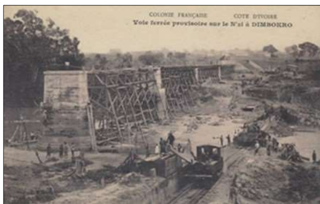
Voie ferrée provisoire sur le N'zi à DIMBOKRO