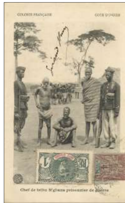
Chief de tribu N'gbans prisonnier de guerre