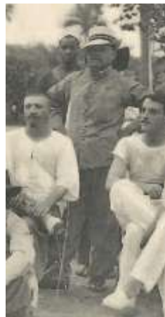
A-24 Groupe de sous-officiers...