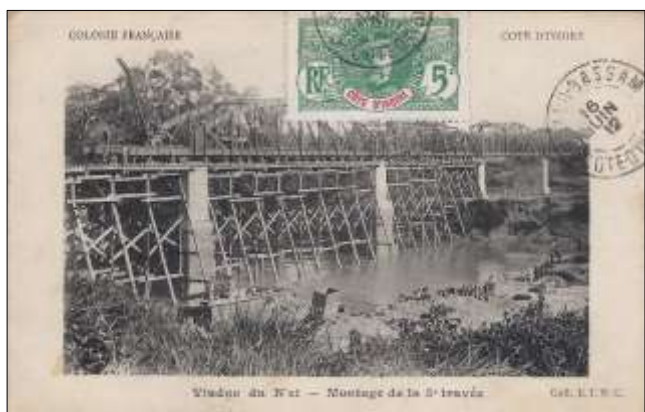
Viaduc du N'zi – Montage de la 5 e travée