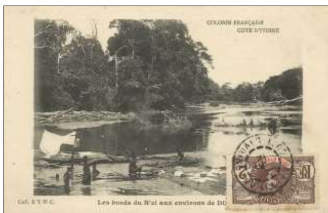
Les bords du N'zi aux environs de DIMBOKRO

16 cartes ont été classées dans ce dernier thème.