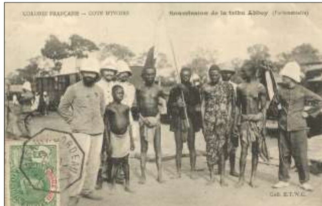
Soumission de la tribu Abbey (Parlementaire)