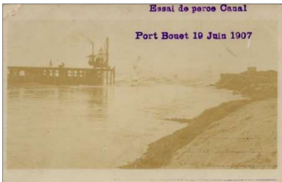
Exceptionnelle photo de l'éphémère canal de Port-Bouët

Lors de son premier séjour en Côte d'Ivoire, mis à disposition de la Direction du Chemin de Fer et Port il semble qu'il ait été affecté à Petit Bassam où avaient lieu les travaux de percement du premier canal à travers le cordon littoral à Port-Bouët. Il a réalisé là une série de clichés sur les travaux et la vie du personnel du chantier. Certains de ces clichés nous sont parvenus sous forme de cartes photos qu'il adressait à une famille de Fleurey-sur-Ouche en Côte d'Or (vraisemblablement la famille de l'un de ses camarades de la campagne de Madagascar). Ayant assisté au chavirage d'une embarcation et l'ayant photographié il put vendre le cliché à l'armateur pour une somme relativement importante pour l'époque (30 F).