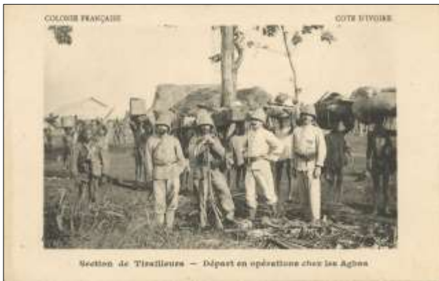
Section de Tirailleurs - Départ en opérations contre les Agbas