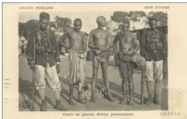
Chiefs de guerre Abbey prisonniers