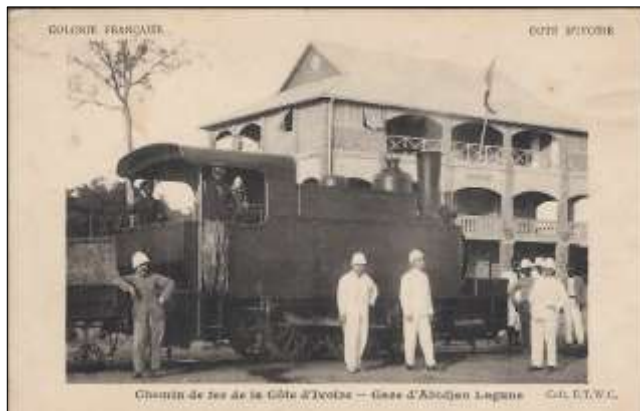
Gare d'Abidjan Lagune