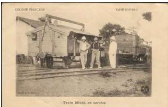
Train blindé en service