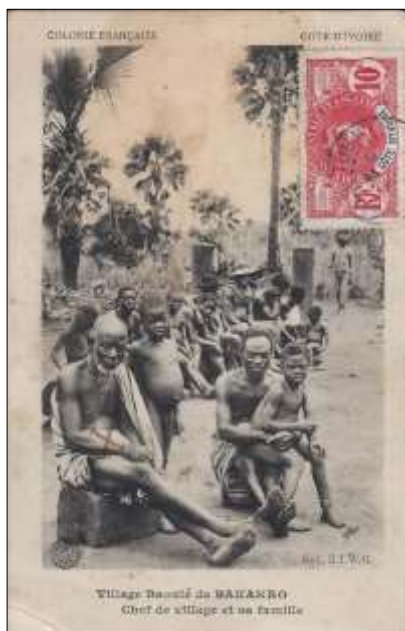
Village Baoulé de BAKAKRO Chef de village et sa famille