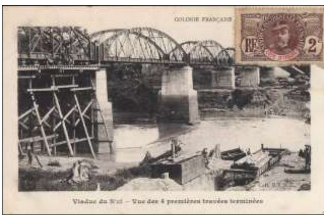
Viaduc du N'zi – Vue des 4 premières travées terminées