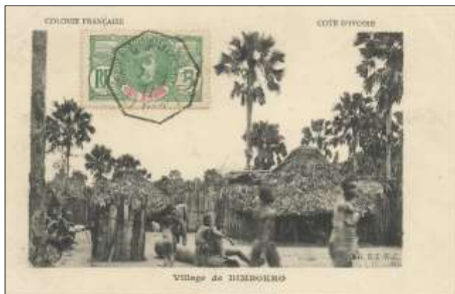
Village de DIMBOKRO