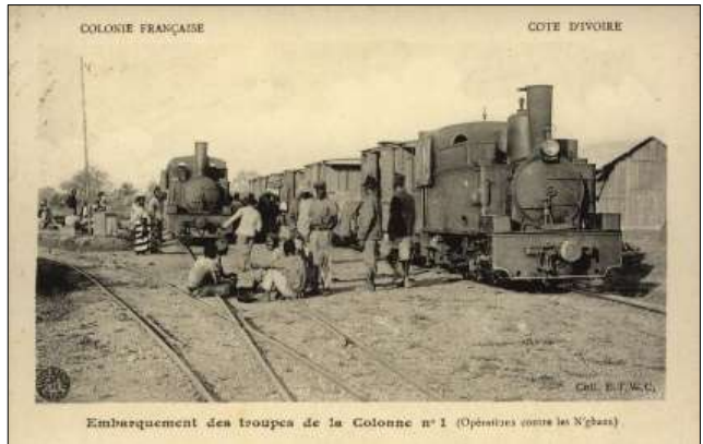
Embarquement des troupes de la Colonne n°1 (Opérations contre les N'gbans)