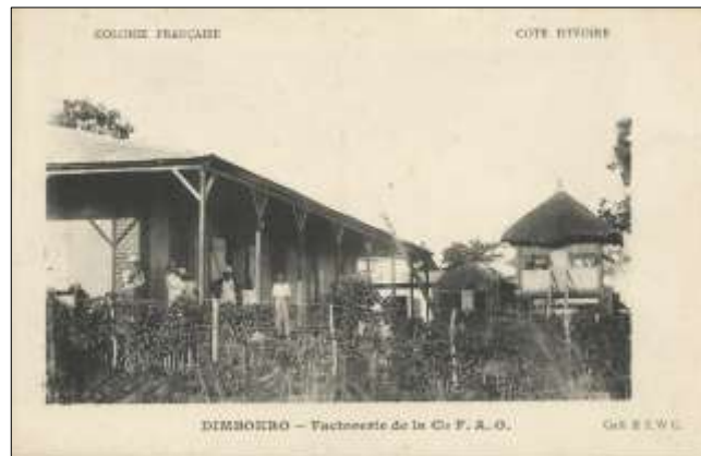
DIMBOKRO - Factorerie de la Cie F. A. O.