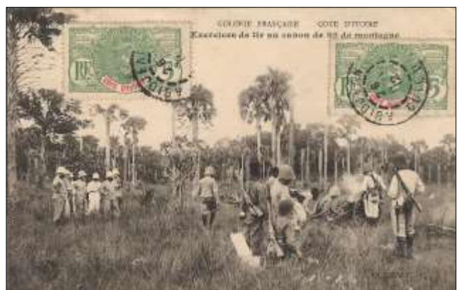
Exercices de tir au canon de 80 de montagne