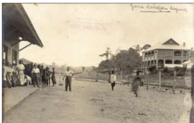
Gare d'Abidjan Lagune

Il continua à faire des photos et des cartes photos dont quelques-unes sont venues jusqu'à nos jours (notamment la visite du Ministre des Colonies Milliès-Lacroix).