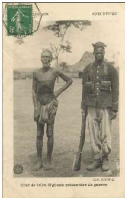
Chief de tribu N'gbans prisonnier de guerre