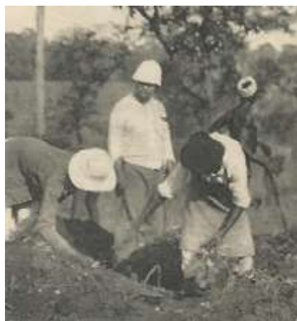
A-12 Culture indigène...

E.T.W.C. s'est mis en scène dans plusieurs cartes. De manière certaine dans celle légendée Hippopotame tué sur le N'zi par le sergent Thai Wan Chang , et très vraisemblablement sur la carte Gare d'Abidjan Lagune où il serait le militaire appuyé contre la motrice à gauche, ainsi que sur la carte Culture indigène (Longans) . Enfin il n'est pas impossible qu'il soit présent également sur la carte Groupe de sous-officiers du Génie, détachés au chemin de fer (debout au centre, avec un chapeau).