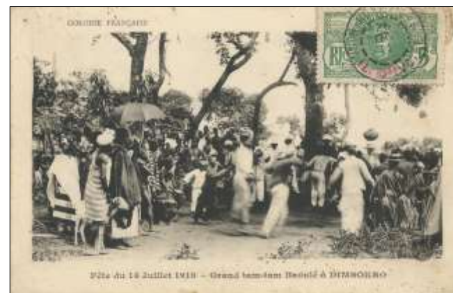
Fête du 14 Juillet 1910 - Grand tam-tam Baoulé à