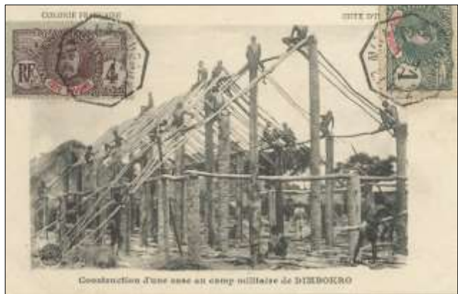
Construction d'une case au camp militaire de DIMBOKRO