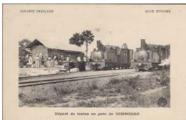
Départ de trains en gare de DIMBOKRO