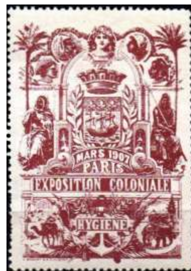
Vignette de l'Exposition coloniale (source : web)

Voilà un mystère résolu et cette carte postale a désormais son histoire.