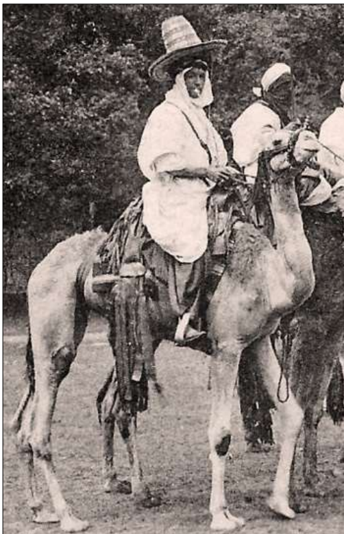
Ci-dessus : Le "Barnum" des Méharistes (détail de la carte postale LL, p. 33)