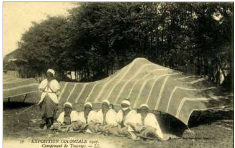
Au centre à droite : EXPOSITION COLONIALE 1907 - 56 - Campement de Touaregs Carte postale LL