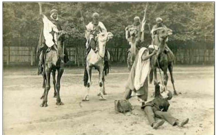
Ci-contre : Scène Touareg