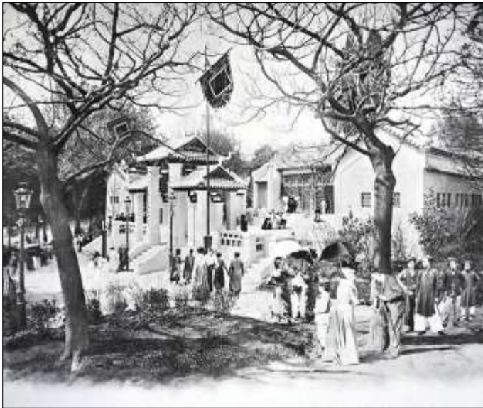
Ci-dessus : Pavillon de l'Exposition coloniale à Nogent (1907)