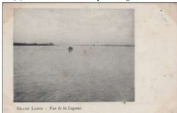
[8] GRAND LAHOU : Vue de la Lagune.