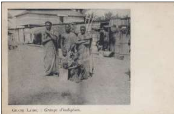
[5] GRAND LAHOU : Groupes d'indigènes.