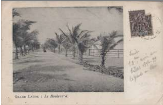
[1] GRAND LAHOU : Le Boulevard