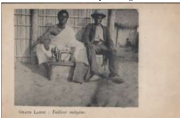
[7] GRAND LAHOU : Tailleur indigène.