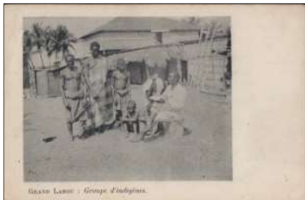
[6] GRAND LAHOU : Groupes d'indigènes.