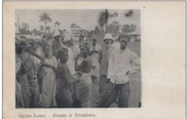
[3] GRAND LAHOU : Dioulas et Tirailleurs