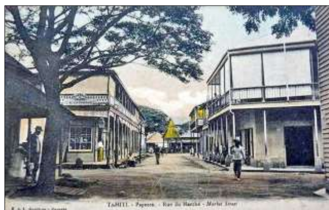
TAHITI. – Papeete. –Rue du Marché. Carte colorisée (postérieurement ?). Source : web.

Édition L. Gauthier, circa 1910. Carte faisant partie d'une très belle série sur les perles et nacrés. Source : web.