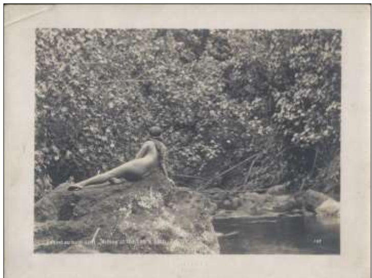
Vahiné au bain Loti - Tahiti

Photographies argentiques 18 x 24 cm. Légendes bilingues (nous n'avons pas transcrit l'anglais) incrustées dans le négatif.