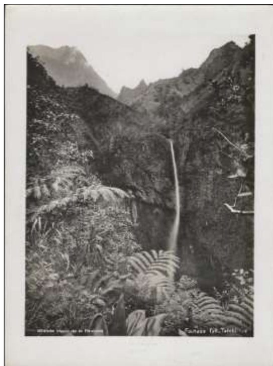
Grande chute de la Fautaua - Tahiti