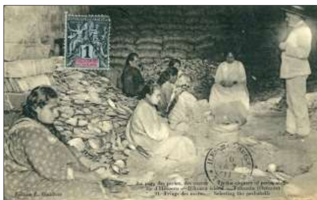
Au pays des perles, des nacrés – Île d'Hikueru – Tuamotu (Océanie) – 91. Triage des nacrés.

Édition L. Gauthier, circa 1910. Carte faisant partie d'une très belle série sur les perles et nacrés.