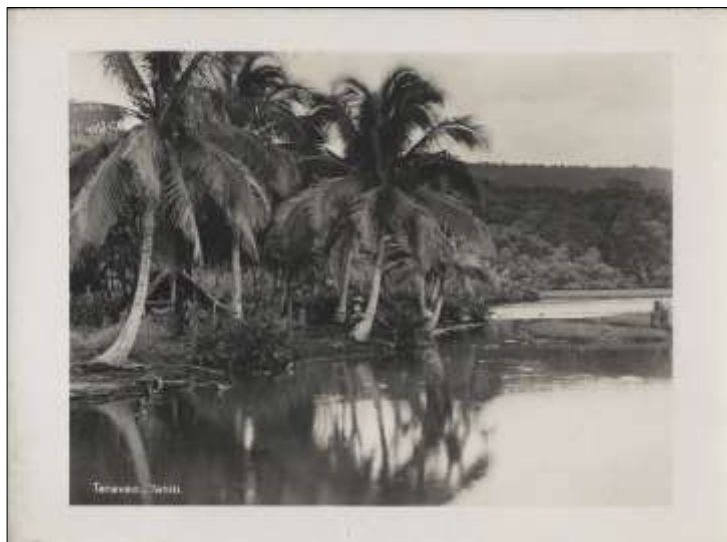
Taravao - Tahiti