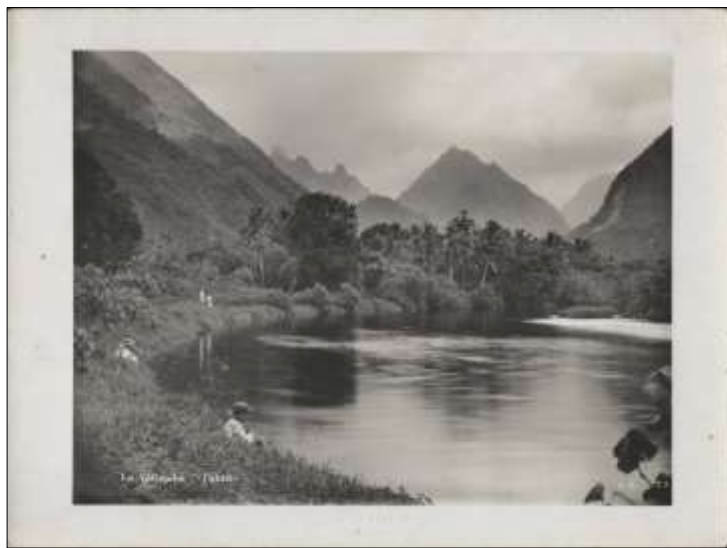
La Vaipatiha (Tahiti)