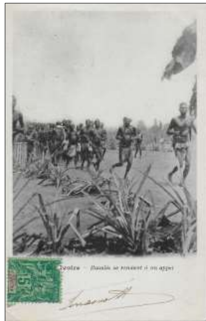
(2) Côte d'Ivoire - Baoulés se rendant à un appel