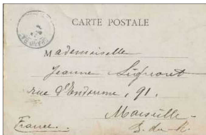
Dos d'une carte postale

Il n'apparaît aucune mention de photographe, d'éditeur ou d'imprimeur. Si quelqu'un a des informations sur l'auteur de cette série nous sommes preneurs.