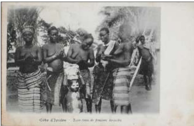
Côte d'Ivoire - Tam-tam de femmes Baoulés