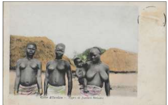
Côte d'Ivoire - Types de femmes Baoulés