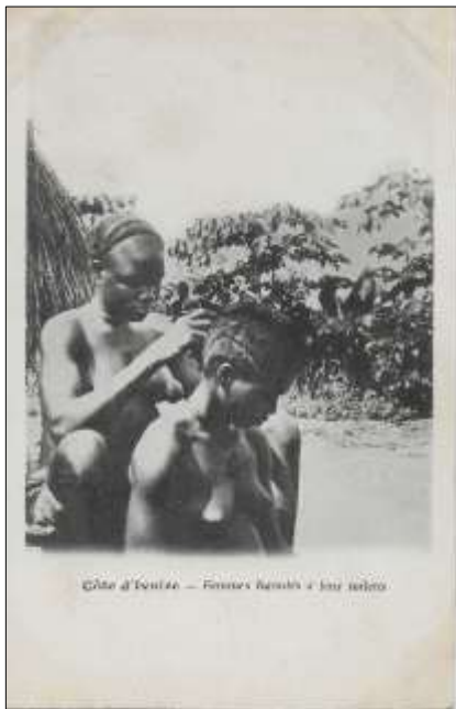
Côte d'Ivoire - Femmes Baoulés à leur toilette