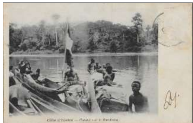
(4) Côte d'Ivoire - Convoi sur le Bandama