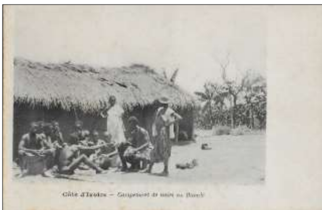
(3) Côte d'Ivoire - Campement de noirs au Baoulé