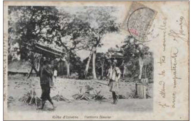
Côte d'Ivoire - Porteurs Dioulas