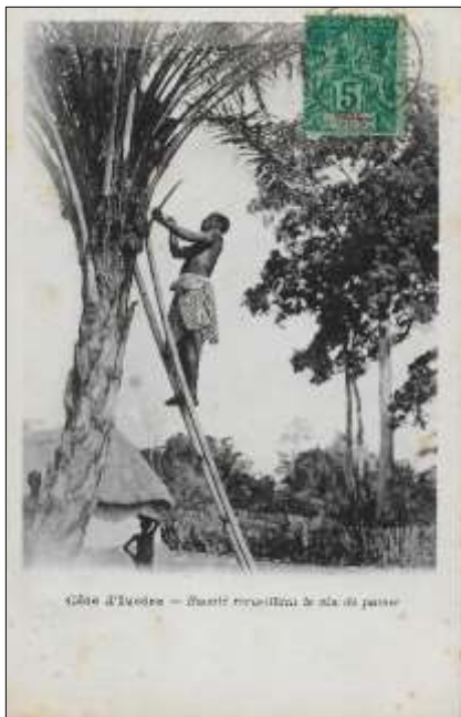
(1) Côte d'Ivoire - Baoulé recueillant le vin de palme