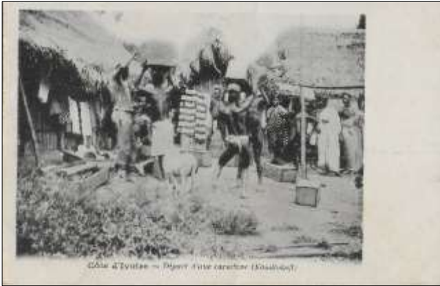
Côte d'Ivoire - Départ d'une caravane (Kouadiokofi)