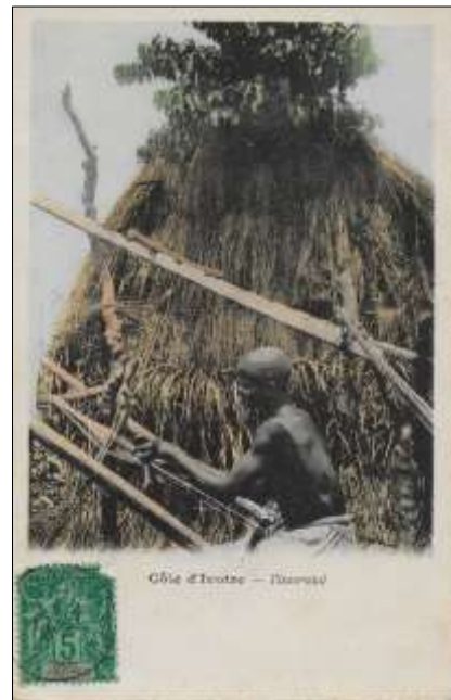
Côte d'Ivoire - Tisserand