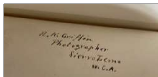
Intérieur de l'Exposition de Sierra-Leone, 1865