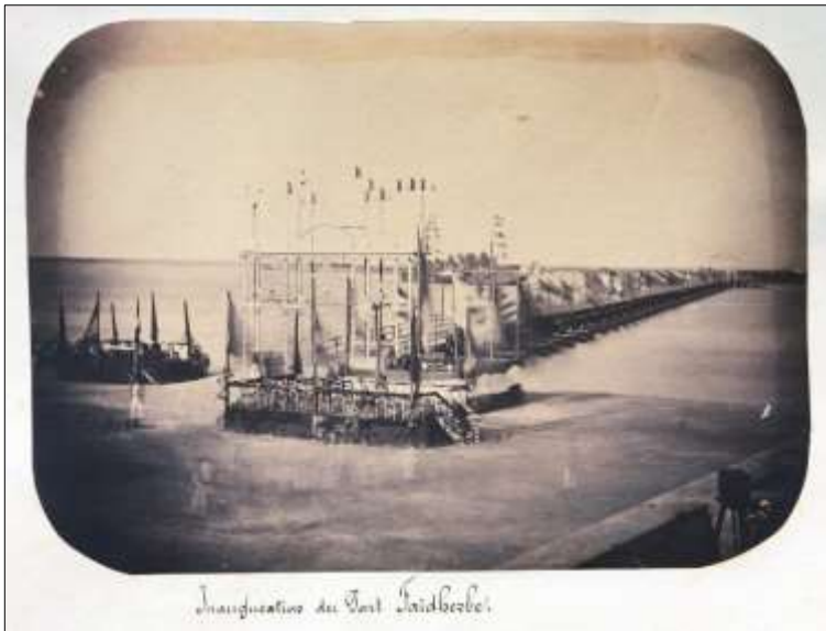
À gauche : Photographie de l'album Pinet-Laprade Le photographe est Auguste Cauvin, chirurgien de la marine.