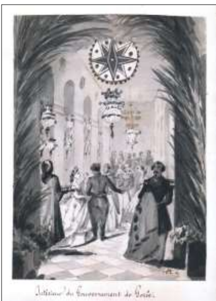
Ci-dessus : Intérieur du Gouvernement de Gorée . Signé et daté : MBC 1865