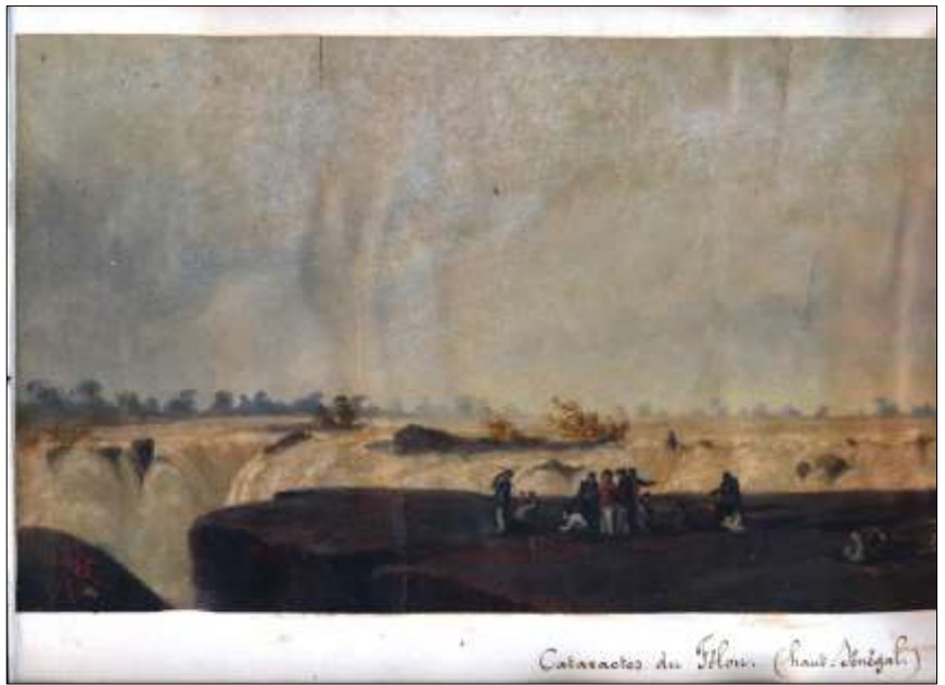
Ci-dessus : Cataractes du Félou (haut Sénégal) , détail Signé et daté : MBC, 1866