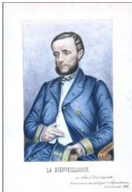
Ci-dessus : Au centre : Ader, La Bienveillance [Portrait du contre-amiral Protet], 1868