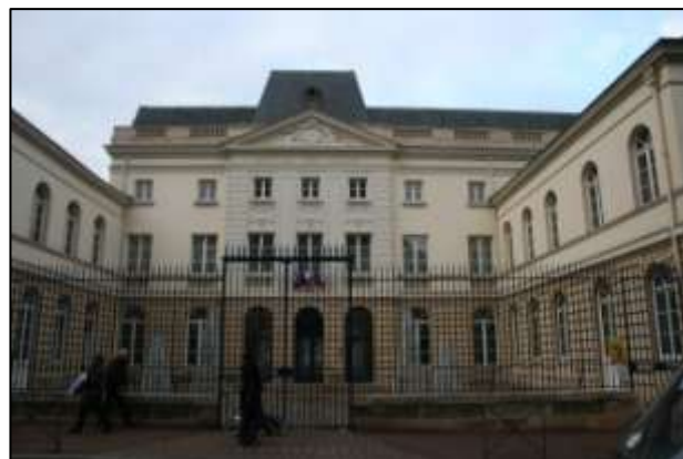
La mairie d'Issy-les-Moulineaux et deux des salles d'exposition

Au sein de cet espace d'exposition, cinq périodes sont représentées (précoloniale, coloniale, des indépendances à aujourd'hui, le présent et l'avenir) et ont donné lieu à une représentation équilibrée. Une centaine de documents iconographiques sont commentés et présentés.