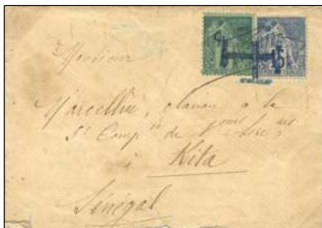
À gauche : L'arrivée du courrier à Ségou. Carte-photo de Marcel Lauroy, vers 1926. Le cliché fut édité en carte postale sous le numéro 1558. Marcel Lauroy réalisa un voyage au Soudan en 1926 à la suite duquel il édita environ 1 200 cartes postales.