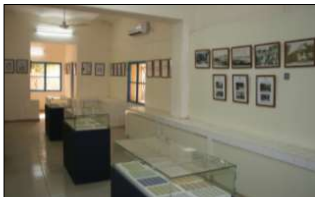
Ci-dessus : L'une des salles d'exposition du Musée de la Poste