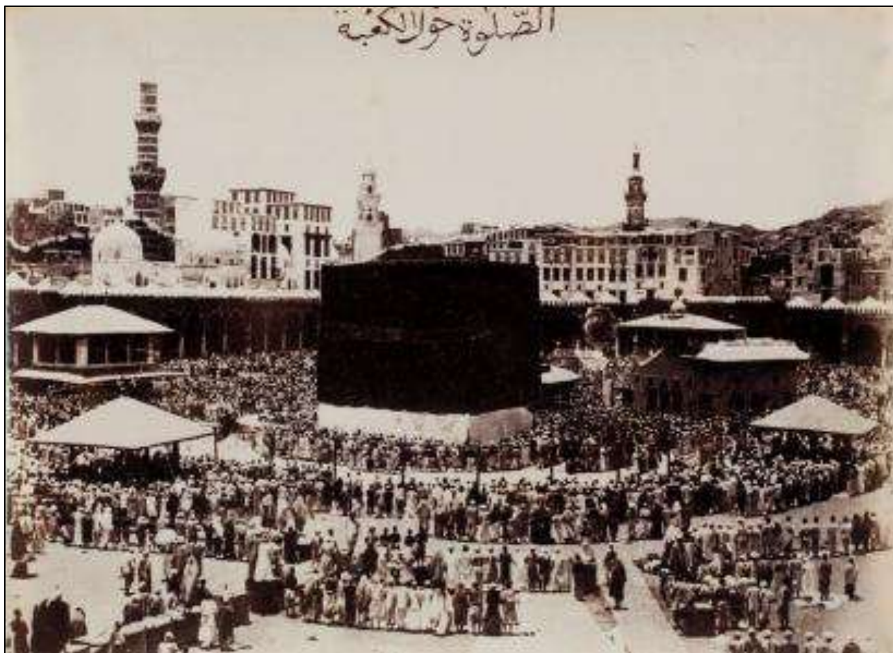
Pèlerinage à la Mecque. La Kaaba.

Photographie de Christiann Snouck Hurgronje Abd al-Ghaffar (1857-1936) – Arabie Saoudite. 1885