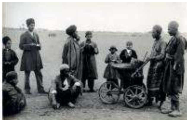
Types perses, Iran vers 1890. Par Antoin Sevruguin (c. 1840-1933)

D'un lot de 5 épreuves argentiques postérieures (c. 1920). 12x19 cm. Adjugé 1000 €.