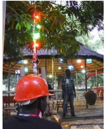
L'entrée de l'exposition dans les jardins de l'Institut Français de Bobo-Dioulasso