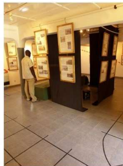
Salles d'exposition de l'Institut Français de Bobo-Dioulasso